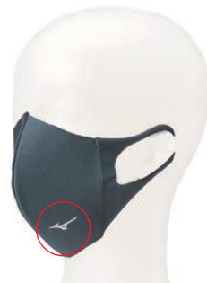
左側に RB マークが入ります。